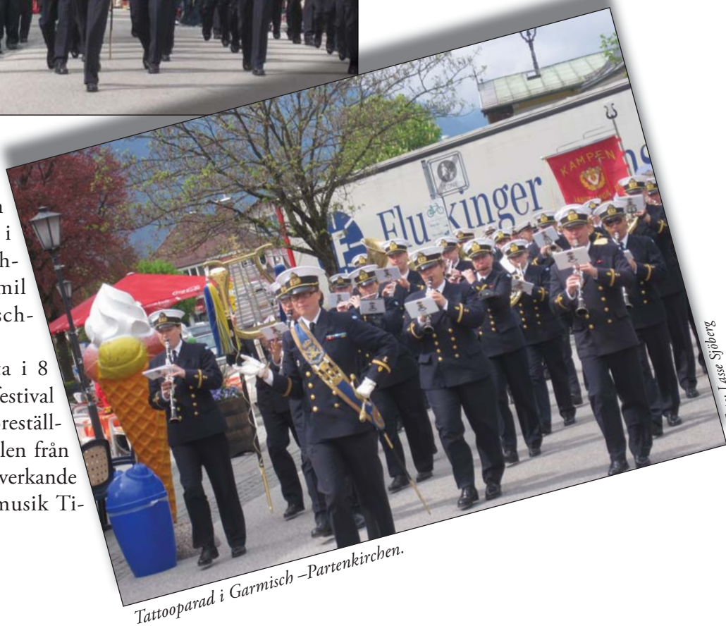
Tattoo parad i Garmisch-Partenkirchen.

Vårt uppdrag var att delta i 8 Internationales Militärmusikfestival in Bayern. Denna festivals föreställningar hölls i konståkningshallen från Vinterolympiaden 1936. Medverkande förutom MMK var: Militärmusik Ti-